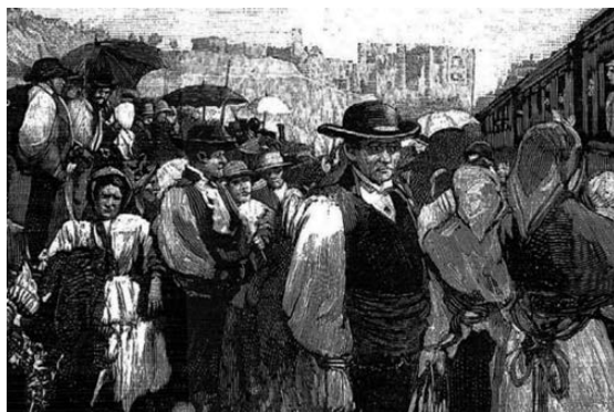
Fig. 3 Llegada del tren a Benavente, al fondo el castillo. Trajes típicos de la comarca de Benavente a comienzos del siglo XX. La Ilustración Española y Americana , (8/VII/1896, detalle).

Sin embargo, los guardias no lo interpretaron como una amenaza, sino como un reflejo de los ánimos exaltados en el pueblo.