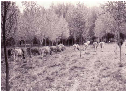
Fig. 4. Vacas en el Sotanzo. Foto archivo familia Costilla, años 70.

En las cercanías de Villaveza confluyen tres ríos (Esla, Tera y Órbigo) que irrigan la fértil vega de la comarca de Benavente. El clima mediterráneo continental provoca grandes oscilaciones en su caudal: en verano pueden sufrir severos estiajes, seguidos de otoños e inviernos muy lluviosos. Durante siglos, la escasez de embalses, canales de desagüe y limpieza de los cauces convertía entonces los ríos en un torrente que se desbordaba sin freno por la llanura hasta acabar generando situaciones catastróficas.